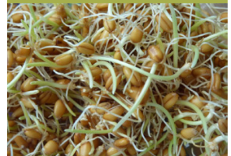
Germogli di frumento