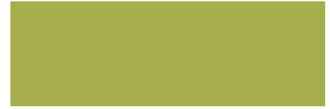
Germogli Alfa-Alfa (Erba medica)

Ogni seme ha un gusto particolare anche se la maggior parte ha un sapore delicato ed erbaceo. Ad esempio i germogli di senape, crescione e rucola sono piuttosto piccanti, quelli di soia, ceci e lenticchie hanno invece un sapore tenue e dolce, i germogli di alfa-alfa (erba medica) dolce, delicato ma saporito, invece i germogli di frumento ricordano un vago sapore di noce.