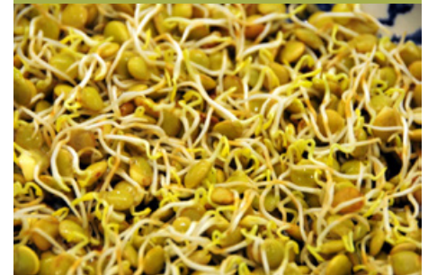
Germogli di lenticchie